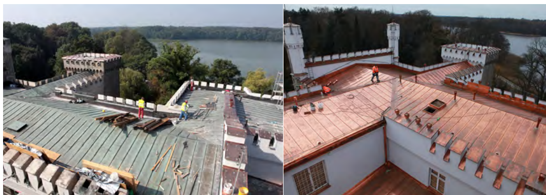
Il. 4. Remont dachu Zamku w Kórniku, 2011 r.