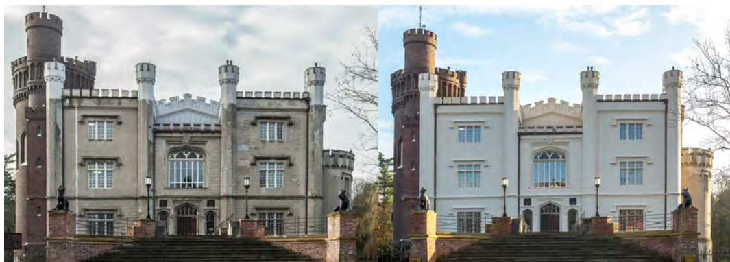
Il. 6. Renowacja elewacji Zamku w Kórniku, stan z 2011 i 2017 r.