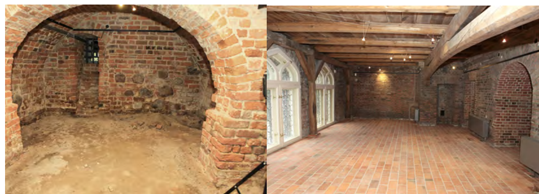
Il. 5. Remont przyziemi zamkowych, stan z 2012 i 2019 r.