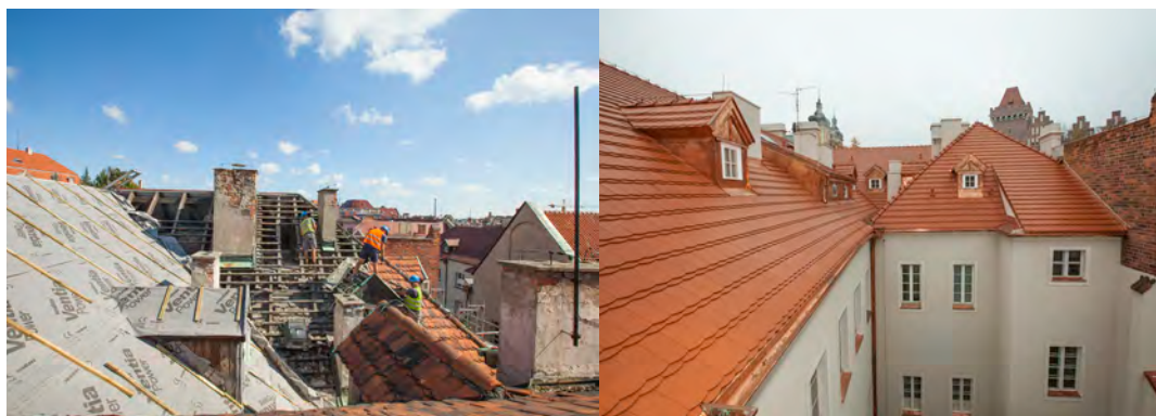
Il. 11. Remont dachu w Pałacu Działyńskich, 2014 r.