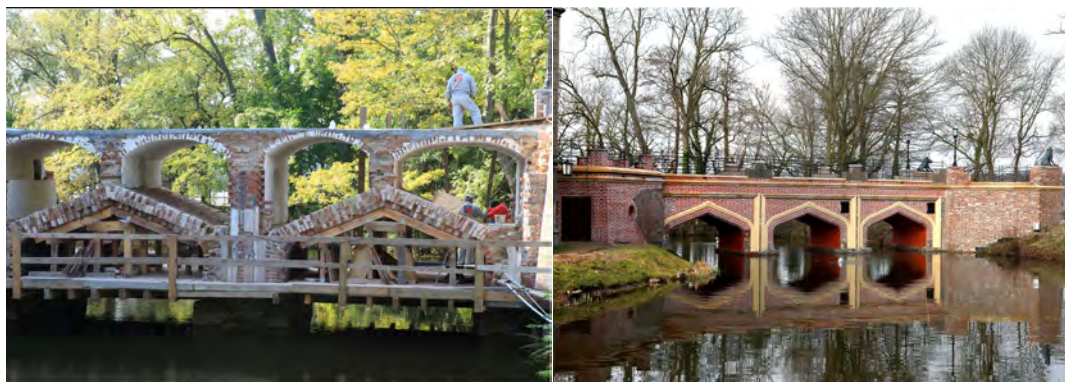
Il. 3. Remont mostu w latach 2009–2011.