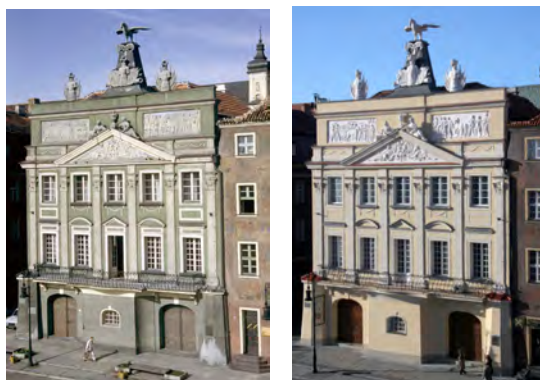
Il. 12. Pałac Działyńskich, stan z 2007 i 2010 r.