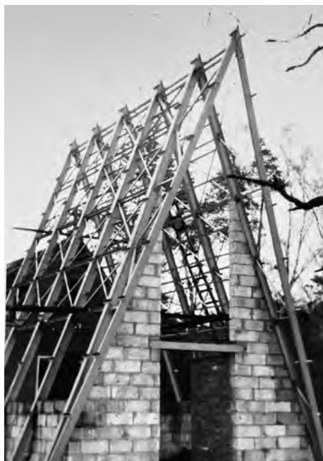
Il. 4. Budowa kościoła filialnego w Radzewicach. Styczeń 1976.