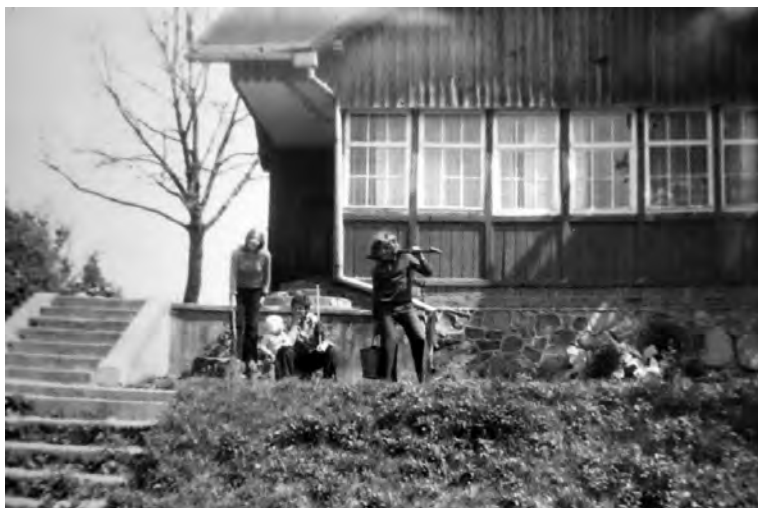
Il. 1. Pastorówka. Radzewice. Przełom lat 60. i 70. XX w.

istniejąca nadal w wyobrażeniu lokalnej społeczności pomimo braku jakichkolwiek materialnych pozostałości oryginalnej budowli 33 .