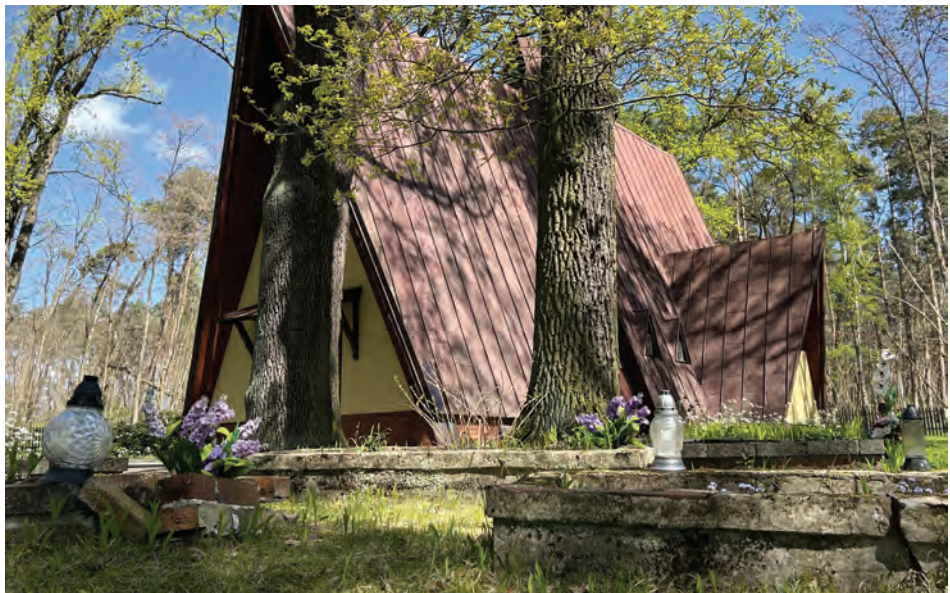
Il. 9. Kościół filialny w Radzewicach. Widok współczesny od strony cmentarza ewangelickiego. Fot. M. Filary