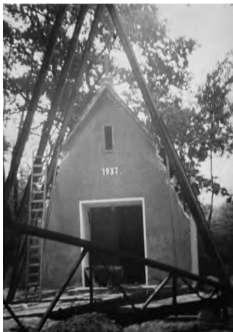
Il. 3. Budowa kościoła filialnego w Radzewicach. Jesień 1975.