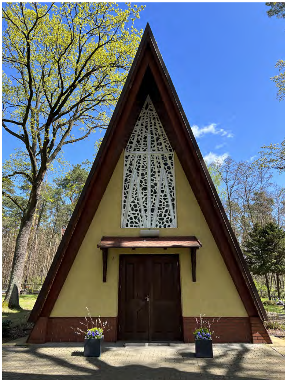
Il. 10. Kościół filialny w Radzewicach. Widok współczesny, fasada.