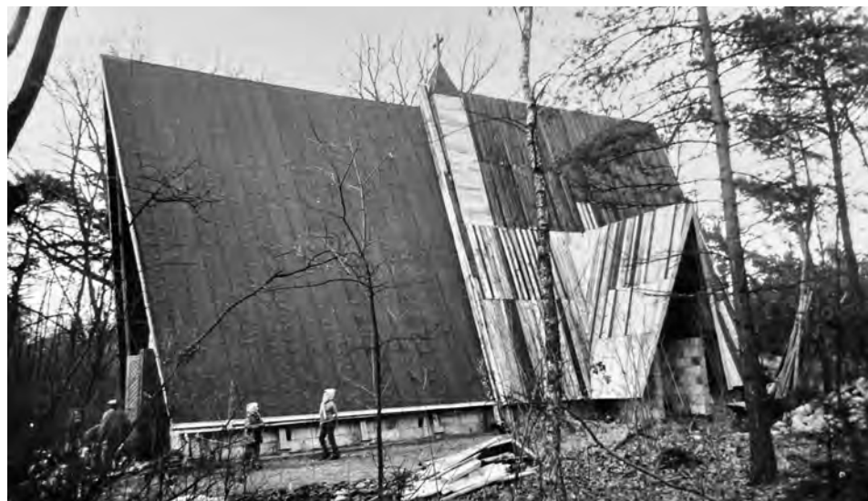
Il. 5. Prace wykończeniowe kościoła filialnego w Radzewicach. Jesień 1976.