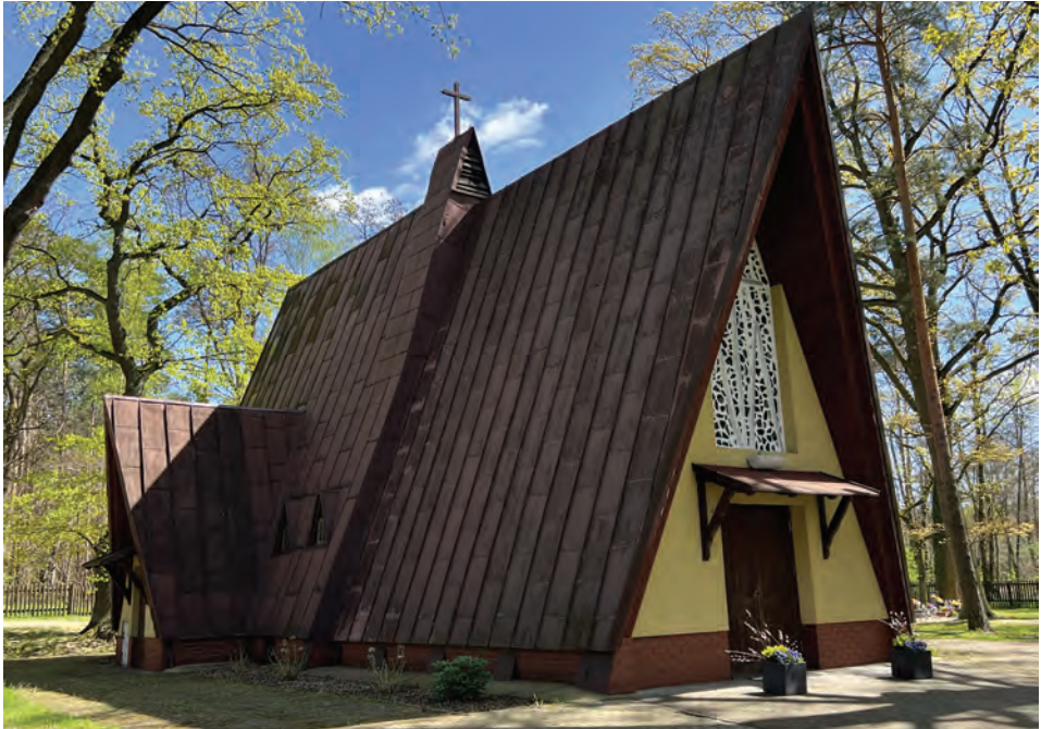
Il. 8. Kościół filialny w Radzewicach. Widok współczesny od strony północnej.