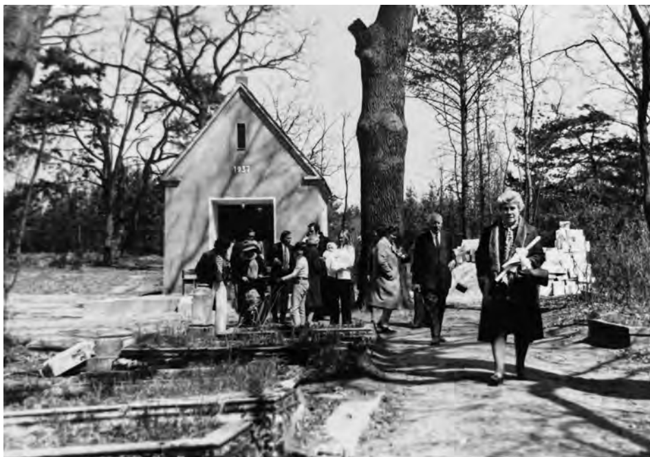
Il. 2. Kaplica cmentarna. Radzewice. Kwiecień 1975.

a nagrobki były mijane. Ich obecność jednak, co jest pewnym precedensem w ramach czasowych objętych zainteresowaniem, nie była ciężarem czy przeszkodą.